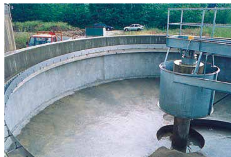
6 L'intervento d'impermeabilizzazione è stato effettuato sempre con VANDEX BB 75 Z anche sulle superfici verticali e orizzontali delle due vasche circolari.