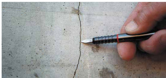
Individuazione di una fessurazione presente nel calcestruzzo.