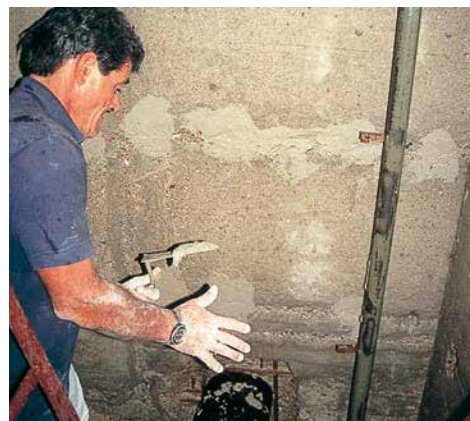
4 Fasi operative inerenti gli interventi di ricostruzione del calcestruzzo eseguite con la malta VANDEX UNIMORTAR 1 Z .