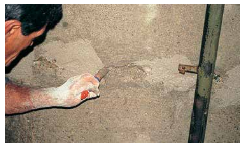
3 Applicazione nelle cavità del calcestruzzo del cemento impermeabilizzante a forte penetrazione capillare VANDEX SUPER . Il prodotto, in consistenza di boiaccia, viene applicato a pennello.