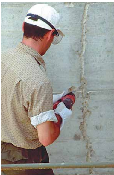
2 Fasi operative inerenti la corretta scalpellatura ed apertura di tutte le lesioni presenti nei getti.