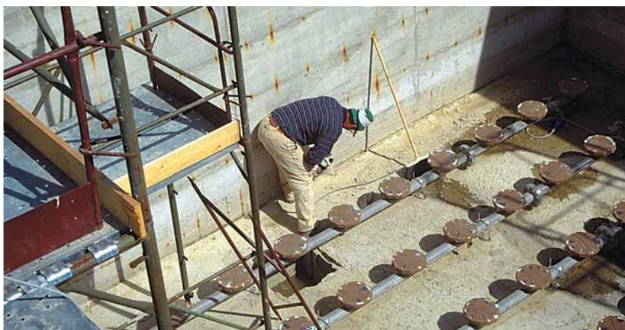
1 Apertura a forma di "V" di tutte le riprese di getto in corrispondenza dell'attacco platea/parete.

La divisione sandtex della Harpo spa , in virtù della sua conoscenza nel campo dei cementi speciali, maturata in oltre un secolo di attività, mette la sua esperienza al servizio del progettista al fine di trovare insieme le soluzioni ottimali per la scelta ad hoc della tecnologia e dei relativi materiali le cui caratteristiche prestazionali ben s'inseriscono nei campi del consolidamento - risanamento murario, del ripristino - rinforzo strutturale delle opere in c.a., dei rivestimenti resinosi nonché nel settore dell'impermeabilizzazione.