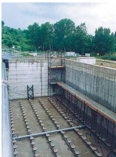
5 I lavori d'impermeabilizzazione sono ormai ultimati entro un paio di settimane a totale stagionatura dei materiali le vasche verranno gradualmente riempite e l'impianto entrerà in funzione.