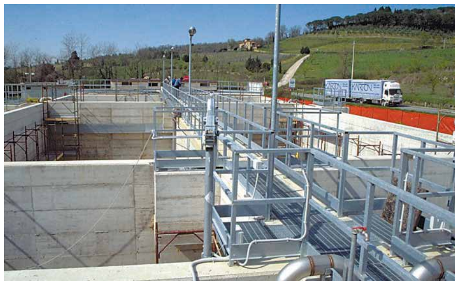
L'impianto di depurazione consiste in sei vasche rettangolari e due vasche circolari.