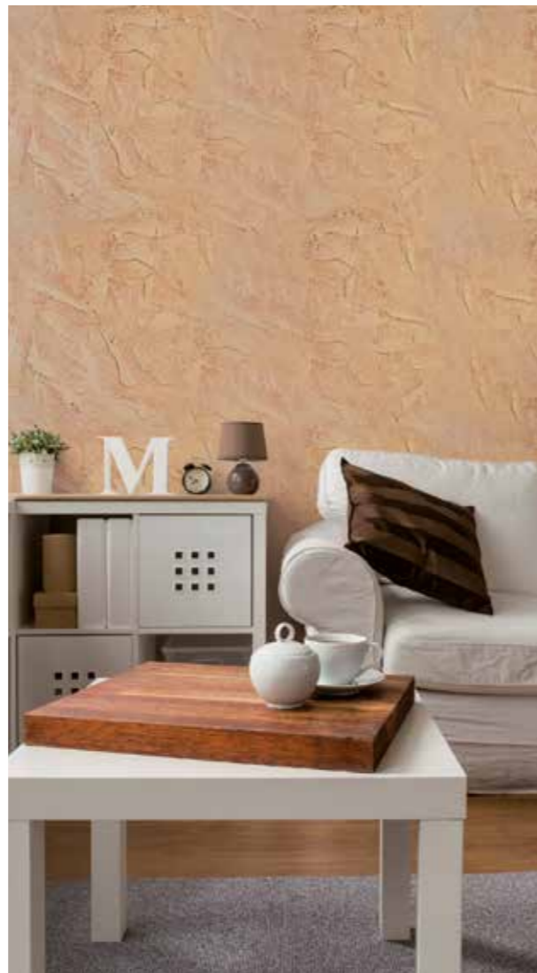
sandtex mediterraneo effetto PIETRA LESSINIA A SPACCO NATURALE ROSA dal catalogo sandtex "mediterraneo"

Vi presentiamo alcuni esempi estratti dal catalogo sandtex mediterraneo , una guida completa per riprodurre effetti e colori delle pietre decorative più rappresentative di tutto il nostro territorio italiano.