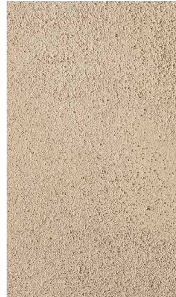
sandtex antiqua 2 frattazzato, colore 008 archimede dalla cartella sandtex "i colori" per le finiture a calce