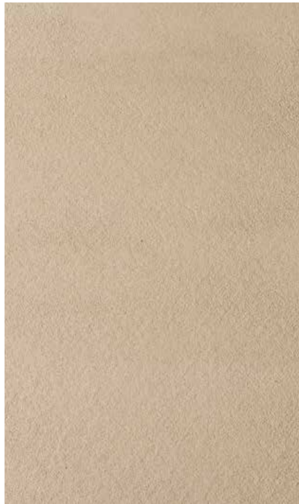
sandtex antiqua 1 lamato, colore 008 archimede dalla cartella sandtex "i colori" per le finiture a calce