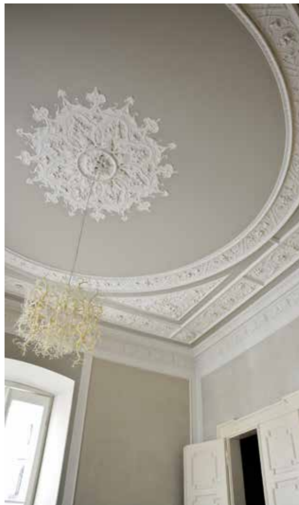
sandtex sinopia colore P2125 dalla mazzetta sandtex "collezione italia"

sandtex sinopia , rifacendosi alle antiche tecniche di produzione ed applicazione degli intonaci a base di idrati di calce, restituisce alle superfici trattate ricchezza cromatica, morbidezza e riflessi di colore propri delle applicazioni tradizionali. Il suo effetto vellutato al tatto, coinvolge l'osservatore in una accattivante esperienza multisensoriale.