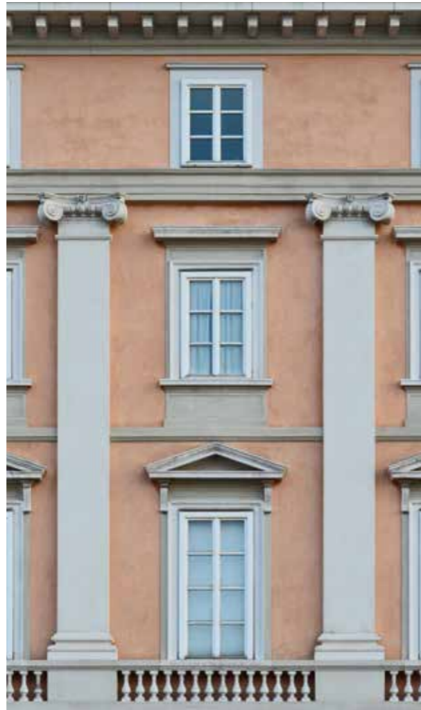
colore venezia dalla cartella colori sandtex epoca spatolato

sandtex epoca spatolato può essere utilizzato da solo per realizzare l'autentico effetto spatolato nei colori classici della calce od in combinazione con sandtex antiqua 1 , con la tecnica dell'affresco. Applicando un lieve strato di prodotto, lamandolo sulla struttura dell'intonaco fine di sandtex antiqua 1 , si darà origine ad effetti unici di calce rasata. Soluzioni antiche nella tecnica ma più che mai moderne nella creatività delle trame e nelle combinazioni di colori.