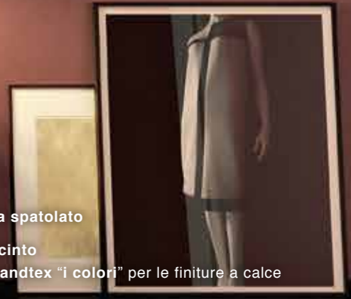
santex epoca spatolato colore 076 giacinto dalla cartella santex "i colori" per le finiture a calce