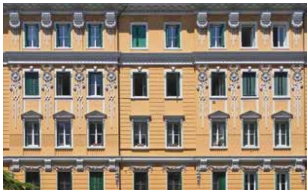
sandtex antiqua 1 colore P1015 dalla cartella sandtex "collezione italia" per esterni

sandtex antiqua è disponibile anche nella versione sandtex antiqua 2 . Essa contiene al suo interno una minima quantità di carbonati scuri. Questa presenza discreta permette di realizzare superfici colorate dall'aspetto finemente rustico.