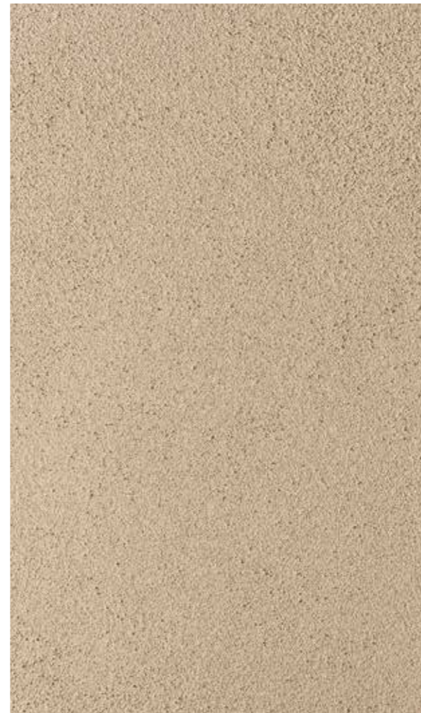
sandtex antiqua 1 frattazzato, colore 008 archimede dalla cartella sandtex "i colori" per le finiture a calce